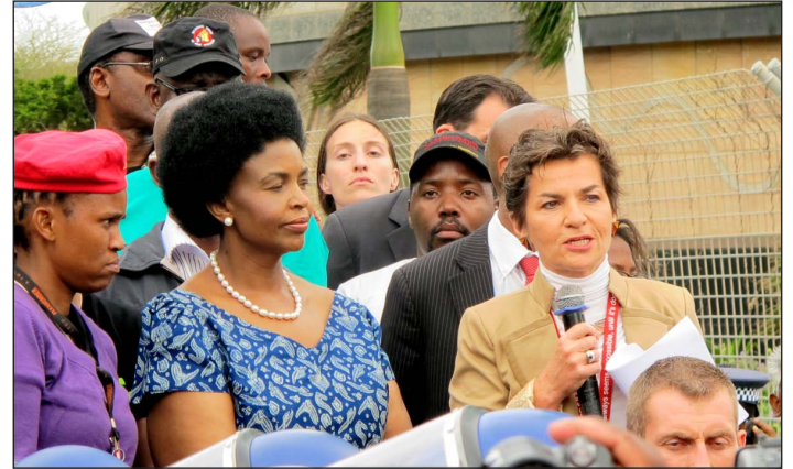
COP17 Başkanı ve UNFCCC Sekreteri eylemcilere konuşma yaparken.

Figueres, konuşmasının başında babasına selam söyledi. Bu mesajın ne anlama geldiği konusunda kulağımıza gelen bilgiler ise hayli ilginç. Figueres'in babası Jose Maria Figueres Kosta Rika'nın eski cumhurbaşkanlarından. Jose Maria Figueres, zirveden birkaç gün önce iklim değişikliğinden en fazla etkilenecek ülkelere "Durban'ı işgal et!" çağrısı yapmıştı. İşgal fikri, özellikle bazı gelişmiş ülkelerin süreci tıkama çabaları nedeniyle her gün daha çok konuşuluyor. COP toplantılarının, Kopenhag'dan sonra sivil toplumun katılmasını zora sokacak yerlerde yapılmaya başlanması ise işgal fikrinin içeriden uygulanma olasılığını da gündeme getiriyor. Durban'da çözüm arayan devletlerin böyle bir kozu kullanmayı düşündüklerine dair fiskoslar artıyor.